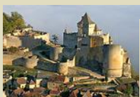
Château de Castelnaud