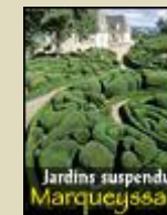
Les Jardins de Marqueyssac