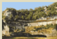
La Roque Saint-Christophe