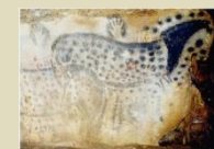
Les Grottes de Pech Merle