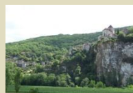
St Cirq Lapopie