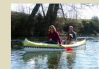
Canoë Roquegeoffre / Canoës Loisirs