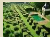
Les Jardins d'Eyrignac