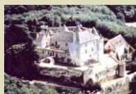
Château de Fénelon