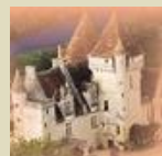
Château des Milandes