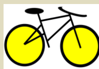
Bike Bus – location vélos