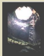
Le Gouffre de Padirac