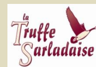
La Truffe Sarladaise, le meilleur du terroir local