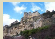
Beynac - village & château